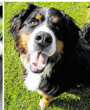
Hündin Angie, Katze Jessica, Esel Emil und die Berner-Sennenhündin Luna: Sie sind nur einige der Tiere, die Sie mit einer Patenschaft unterstützen können

W eihnachten naht mit riesigen Schritten und auch dieses Jahr ist der sehnlichste Wunsch vieler Kinder ein kleines Kätzchen, ein Hundebaby, Hasen, Meerschweinchen & Co. Dabei darf trotz der Weihnachtsidylle nicht vergessen werden, dass sich Tiere für diesen Anlass nicht als Geschenk eignen. Sind die Feiertage vorbei, ist das Interesse an den neuen Spielgefährten oft schnell wieder erloschen. Sie werden vernachlässigt und landen schließlich im Tierheim oder auf einem Assisi-Hof des Österreichischen Tierschutzvereins (ÖTV). „Alle Jah-